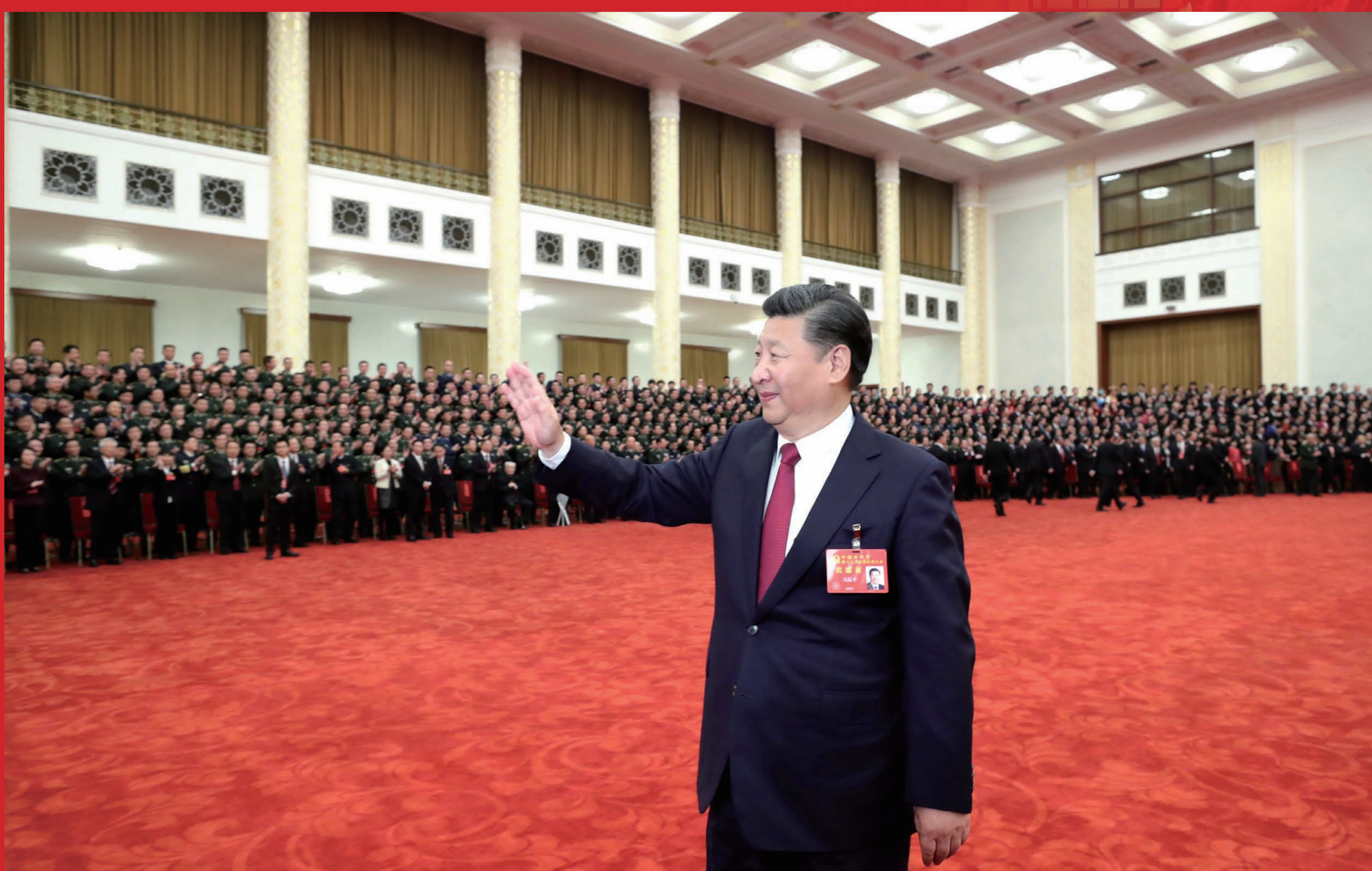
2017年10月25日，中共中央总书记、国家主席、中央军委主席习近平等领导同志在北京人民大会堂亲切会见出席党的十九大代表、特邀代表和列席人员。