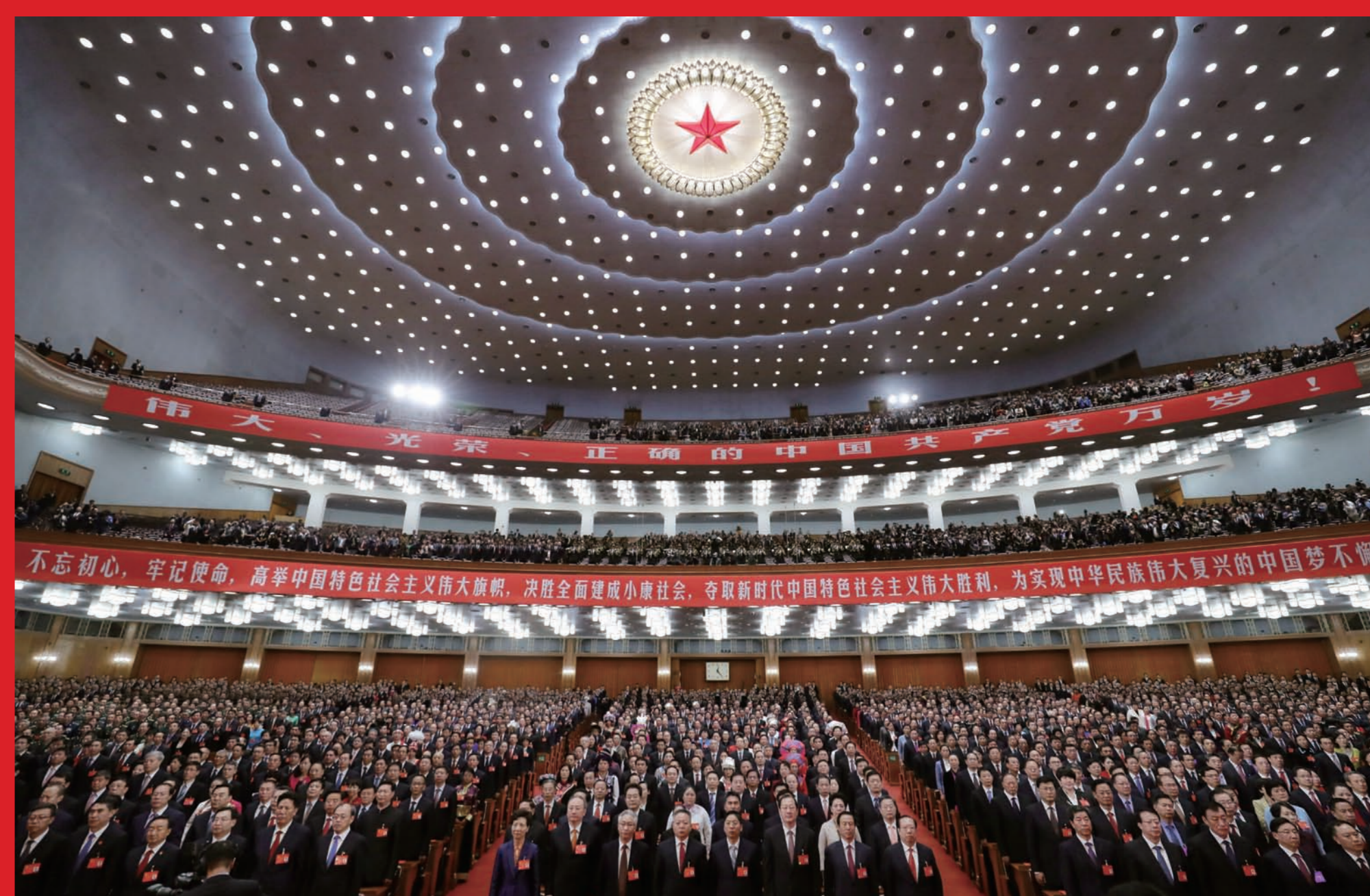
2017年10月24日，中国共产党第十九次全国代表大会闭幕会在北京人民大会堂举行。图为全体起立，奏《国际歌》。