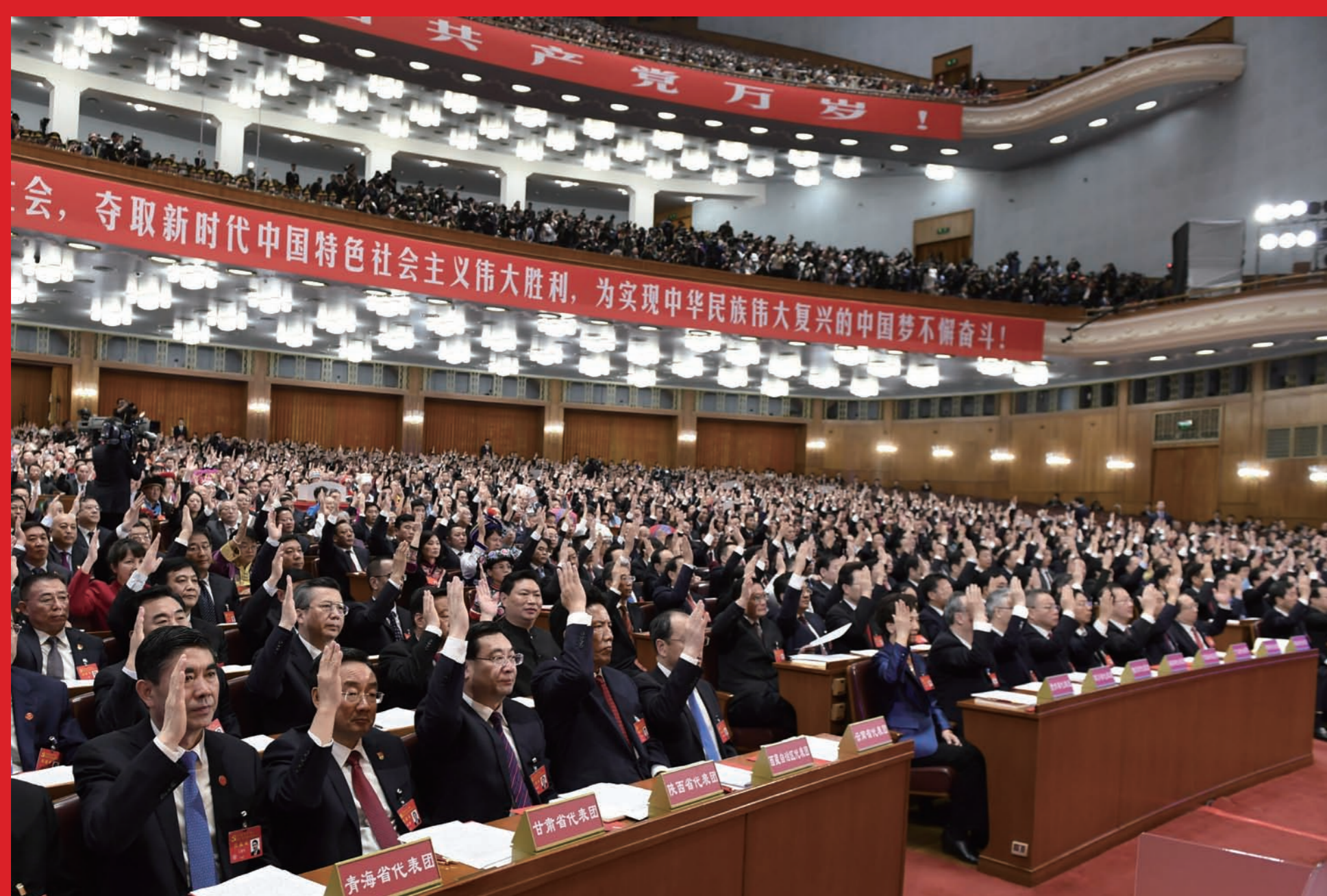
代表在会上举手表决。