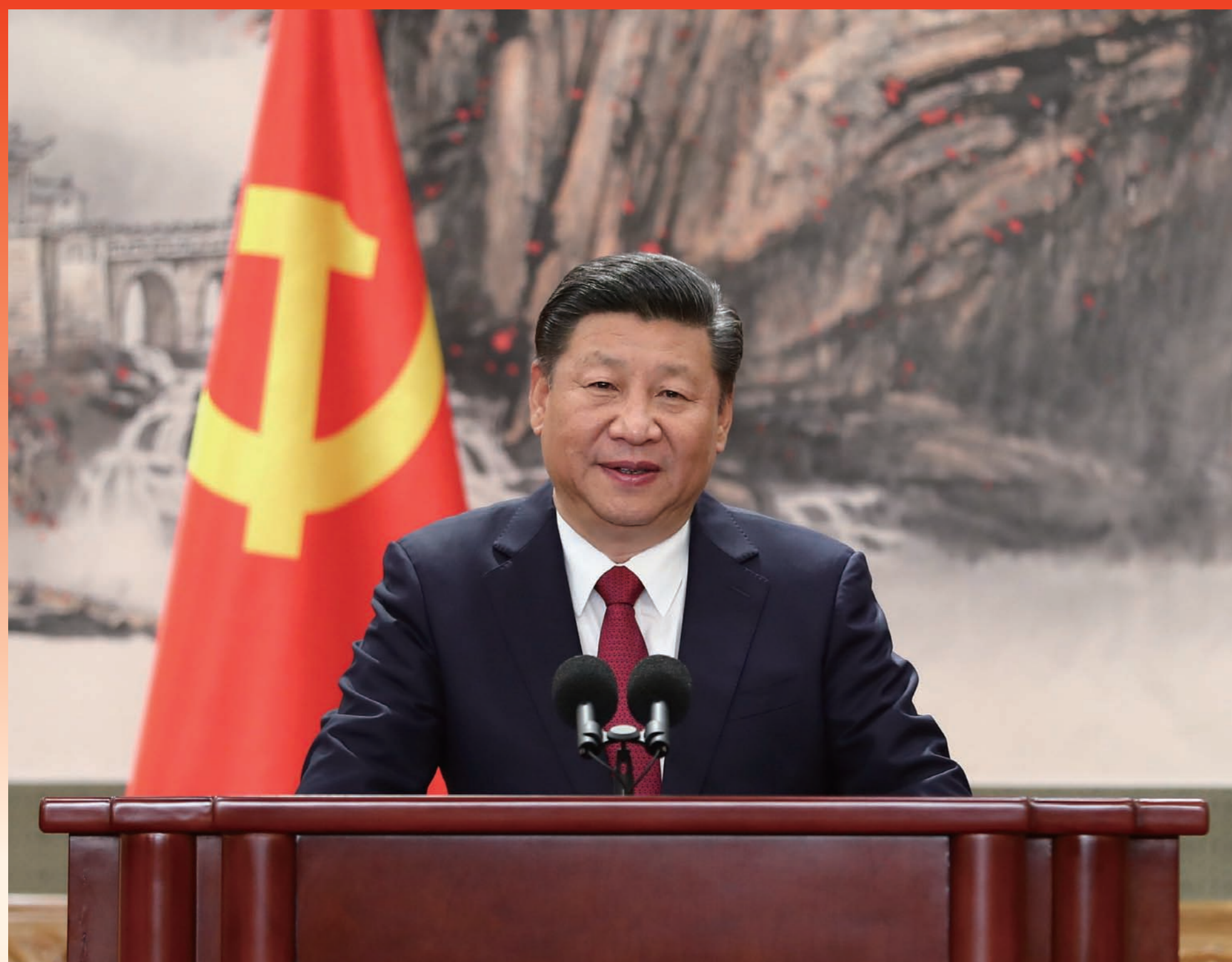
2017年10月25日，在中共十九届一中全会上当选的中共中央总书记习近平同采访十九大的中外记者见面时发表重要讲话。

从全面建成小康社会到基本实现现代化，再到全面建成社会主义现代化强国，是新时代中国特色社会主义发展的战略安排。我们要坚忍不拔、锲而不舍，奋力谱写社会主义现代化新征程的壮丽篇章。