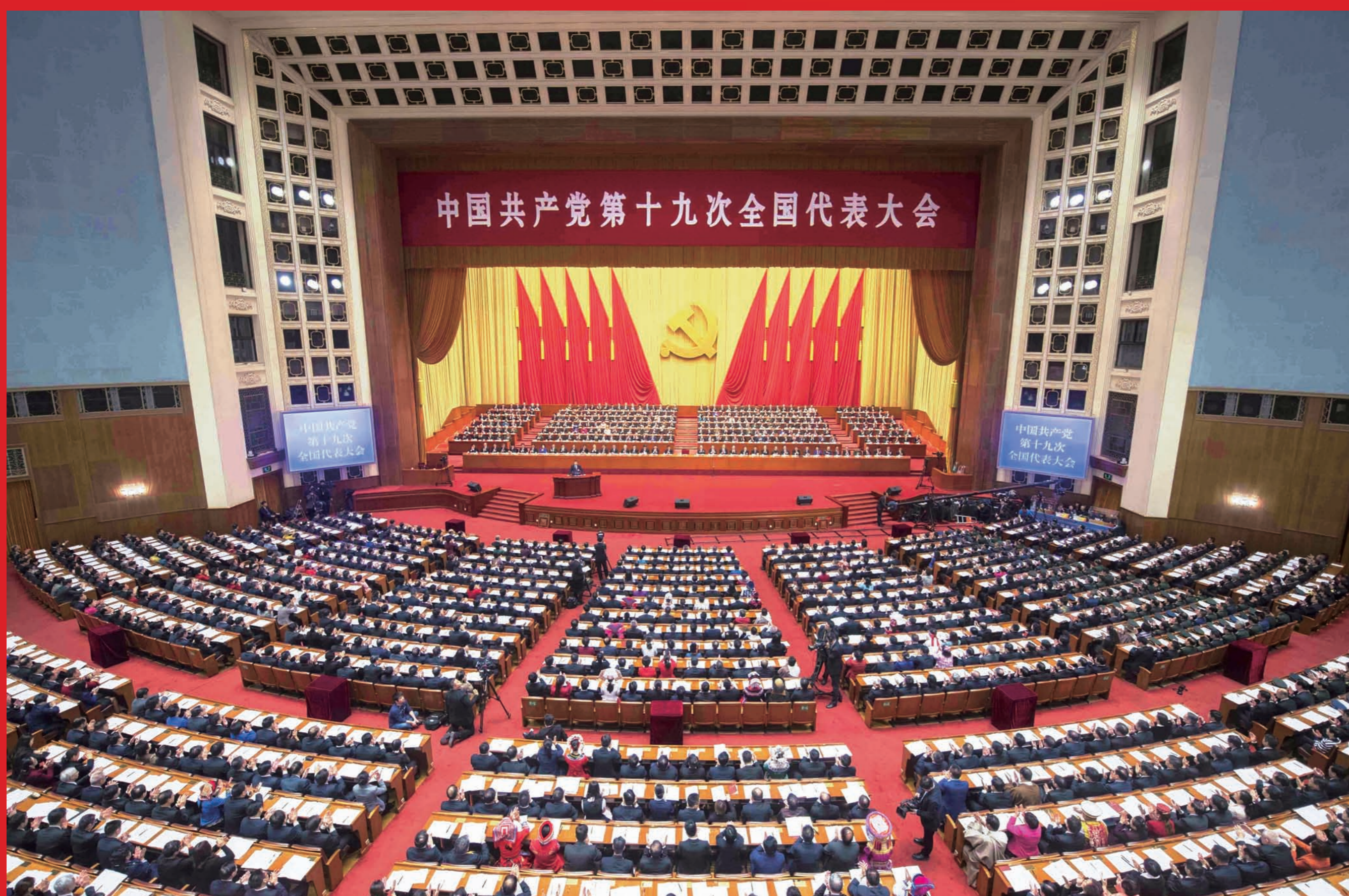
2017年10月18日，中国共产党第十九次全国代表大会在北京人民大会堂隆重开幕。

大会主题：不忘初心，牢记使命，高举中国特色社会主义伟大旗帜，决胜全面建成小康社会，夺取新时代中国特色社会主义伟大胜利，为实现中华民族伟大复兴的中国梦不懈奋斗。