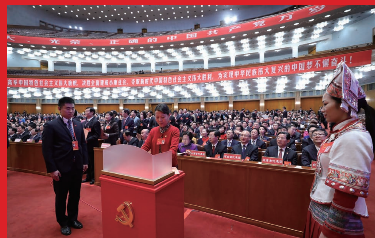
2017年10月24日，中国共产党第十九次全国代表大会代表投票选举中央委员会委员、候补委员和中央纪律检查委员会委员。