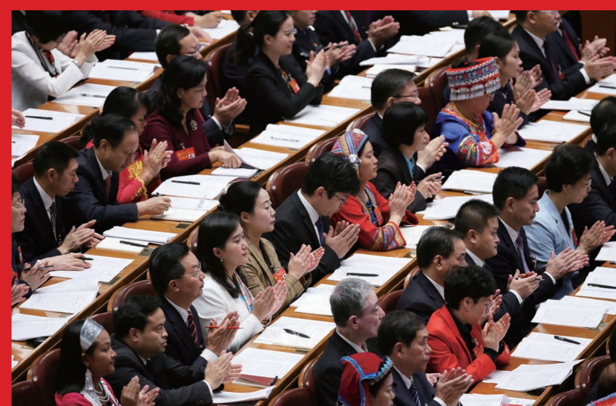
2017年10月18日，代表在中国共产党第十九次全国代表大会上听取报告。