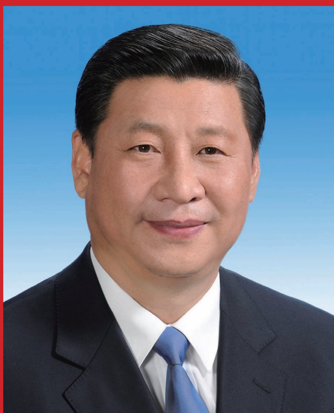
中共中央委员会总书记、中央军事委员会主席习近平

“中国特色社会主义进入了新时代”，这是党的十九大对我国发展新的历史方位的科学判断，也是贯穿党的十九大报告的一条主线。在新时代坚持和发展中国特色社会主义，就要深刻认识新时代的重大意义和丰富内涵，就要深刻认识新时代我国社会主要矛盾的历史性变化，从而牢牢把握我们党在新时代的历史使命，更好进行伟大斗争、建设伟大工程、推进伟大事业、实现伟大梦想，在新时代中国特色社会主义的伟大实践中，以党的坚强领导和顽强奋斗，激励全体中华儿女不断奋进，凝聚起同心共筑中国梦的磅礴力量。