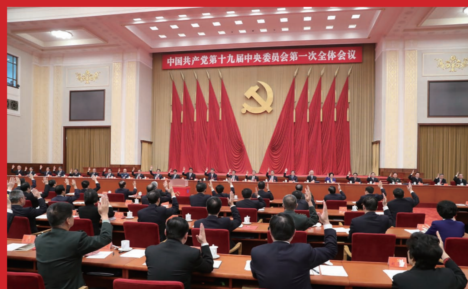
2017年10月25日，中国共产党第十九届中央委员会第一次全体会议在北京人民大会堂举行。